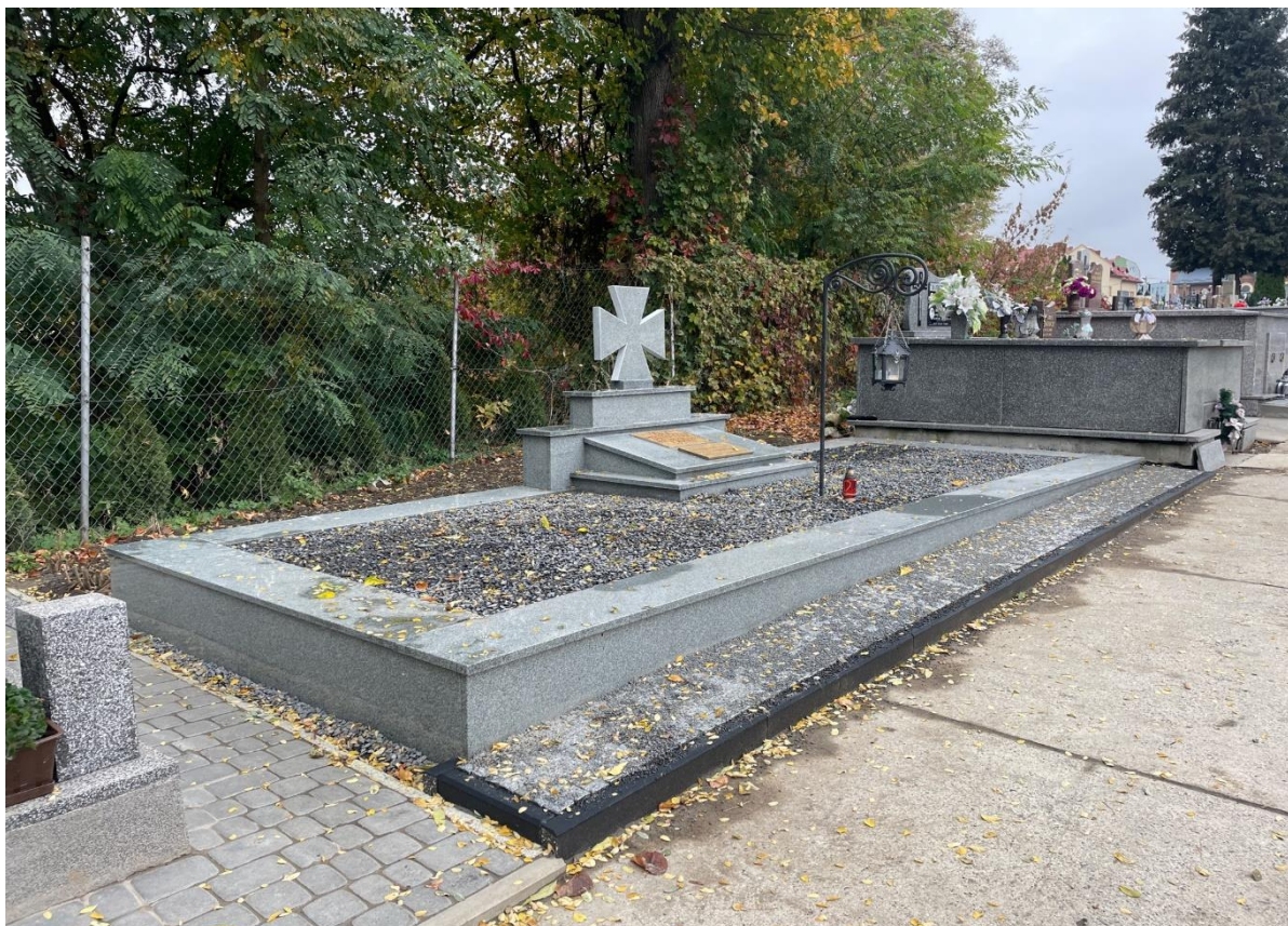
grób Żołnierzy Wojska Polskiego z 1939r. po remoncie