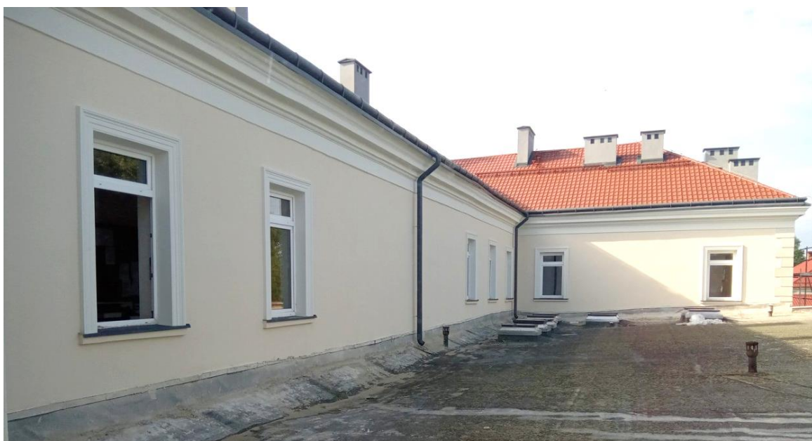
Źródło: Fotografia odnowionej elewacji z piętra budynku – opracowanie własne z dnia 08.08.2023 r.